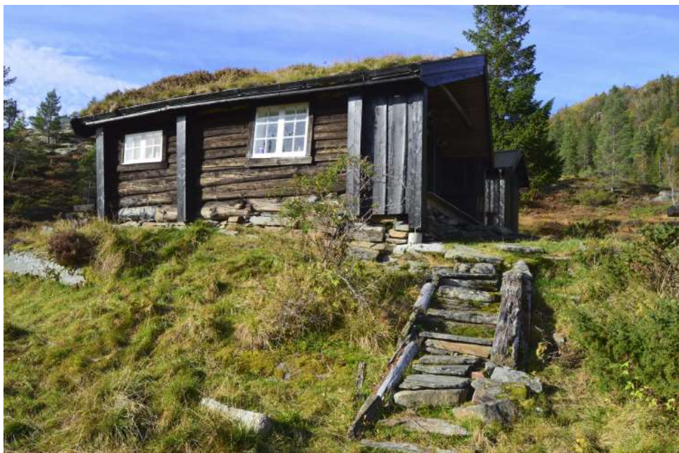
Seterstua slik den er i dag som hytte