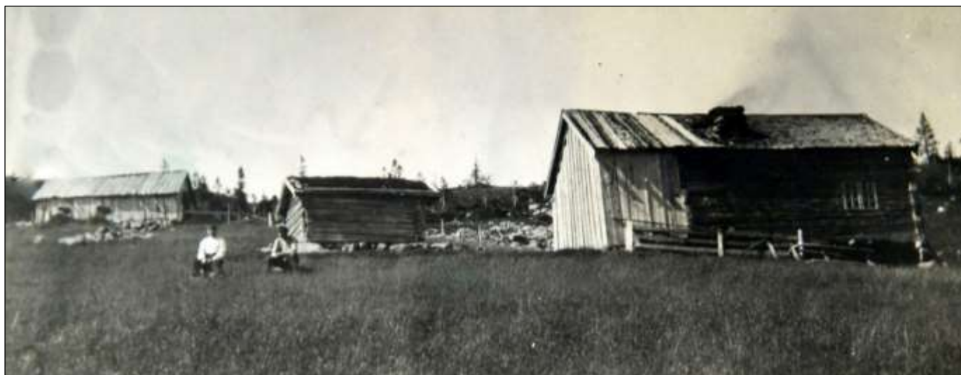
Stampsetra, mange av husa er borte i dag.